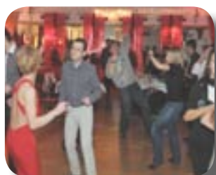
▶▶▶ Repas de Noël