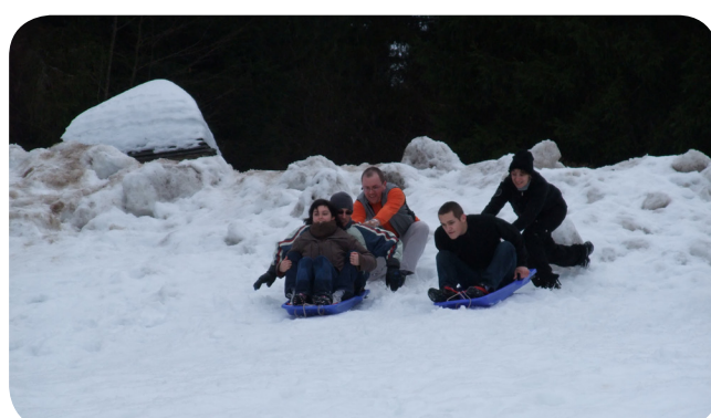
... et luge !