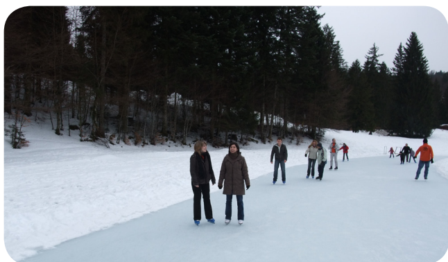
Sortie du dimanche : Patin à glace ...

Prochaine sortie : dimanche 29 mars, voie verte du Beaujolais.